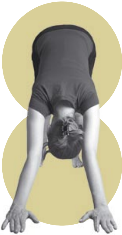
kyynärnivelet yli- ojentuneet alaspäin katsovassa koirassa