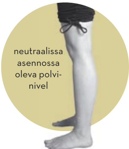
neutraalissa asennossa oleva polvi- nivel