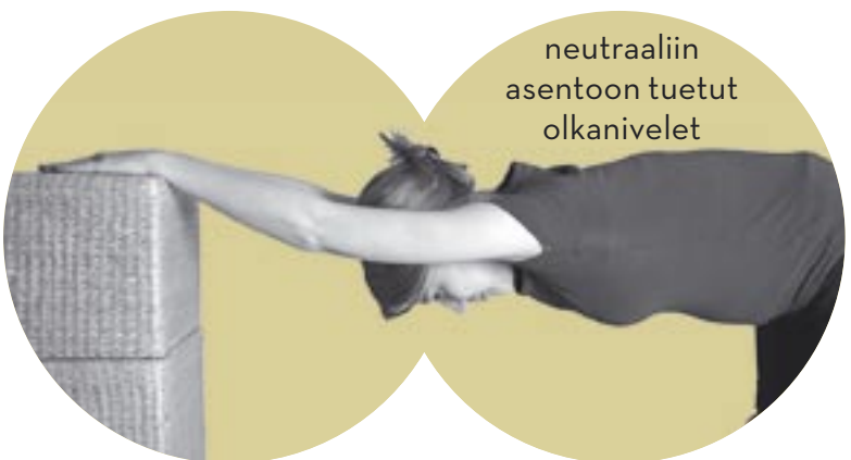
neutraaliin asentoon tuetut olkanivelet

kiertoja ja keskittyä sen sijaan vartaloa stabiloiiviin, syviä vatsa- ja selkälihaksia vahvista- viin asanoihin, joita ovat muun muassa tasa- painoa kehittävät harjoitukset. Myös lantionpohjan vahvistaminen kuuluu selän tukitoimiin. Koska yliliikkuva selkä aiheuttaa rankaan helposti virheasentoja, esimerkiksi suurentuneen lannerangan notkon, tulisi harjoittaa myös tasapainoista ja symmetristä seisoma-asentoa.