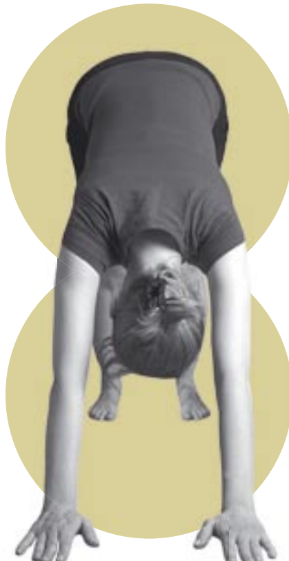
kyynärniveltet tuettuna neutraaliin asentoon samassa asanassa