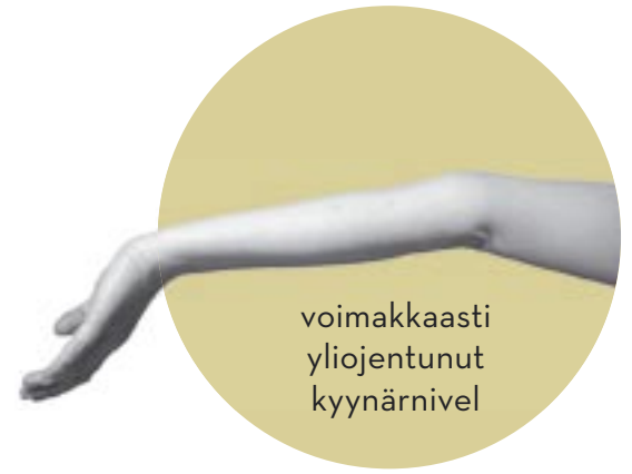
voimakkaasti yliojentunut kyynärnível