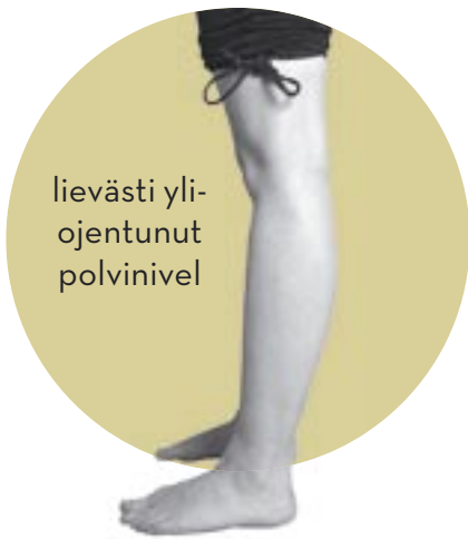
lievästi yli- ojentunut polvinivel